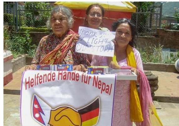
Übergabe des Wassertanks und der Solarlampen